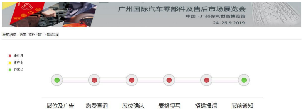
图 6 系统主页面