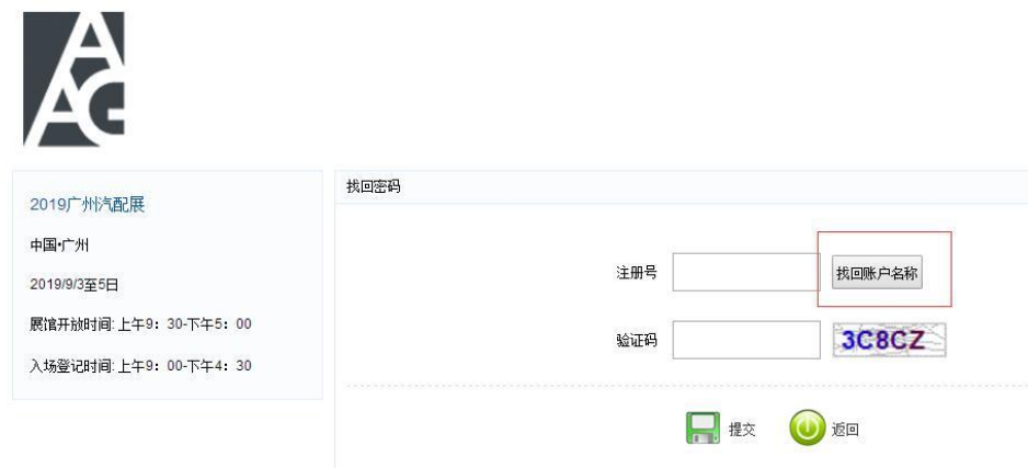
图 16 密码找回界面