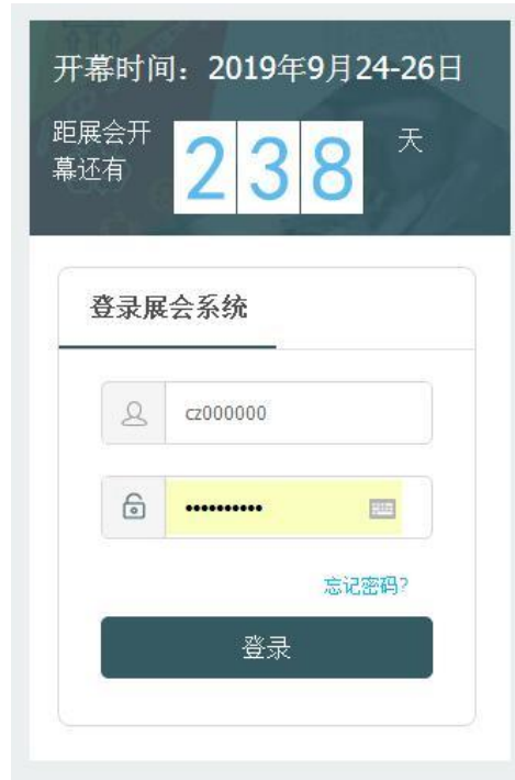
图 5 系统入口