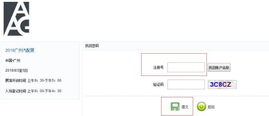
图 15 密码找回界面