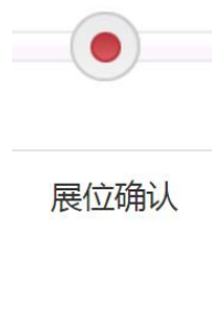
图10 展位确认书查询功能

在展位确认功能模块下，您可以查收到当届参展所必须的展位确认书，展位确认书是您参展时的领取证件的唯一凭证，请务必及时下载以了解您的展位情况。