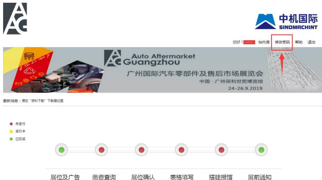
图 13 修改密码界面

贵司工作人员在取得账户密码后，强烈建议先修改原始登录密码以保证您的帐户信息安全。同时请您牢记您账户名称或保存好系统发给您的确认短信或邮件以便随时查阅。如果一旦您的密码遗忘可以通过登录入口处的“忘记密码”选项重置密码，但届时需要您的用户名，所以用户名请务必记录好不要丢失。