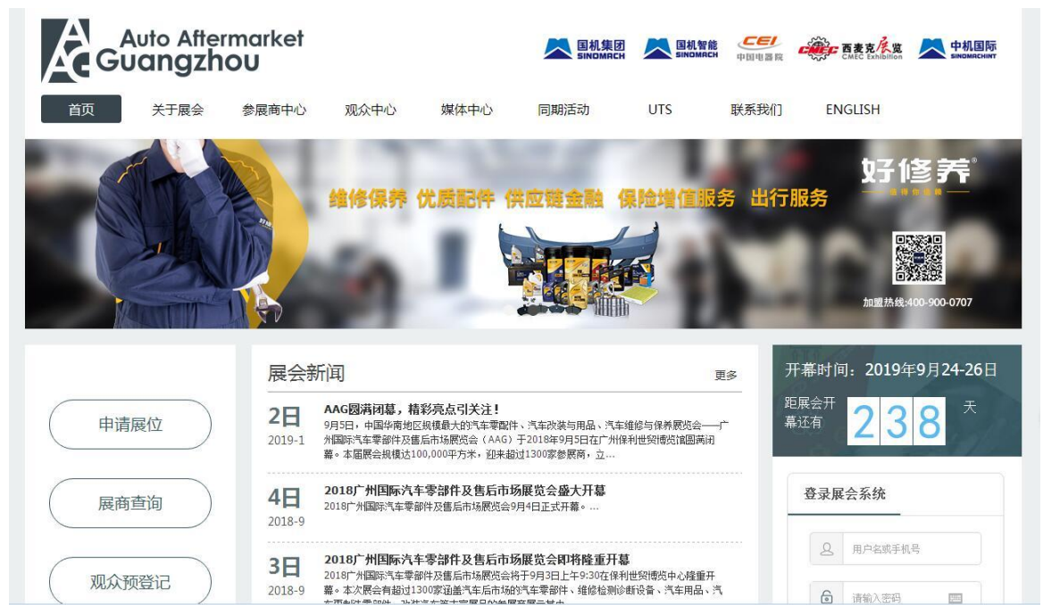
图 1 网站首页

本系统是基于互联网 B/S 模式建立的在线数据管理系统，您可以通过展览会官方网站 http://www.aag.org.cn/ 登入界面。