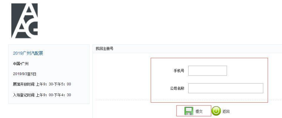
图 17 密码找回界面

本次系统更新中不同程度存在系统不稳定情况，当系统反应不及时，切勿重复刷新加载，以免造成数据遗失。