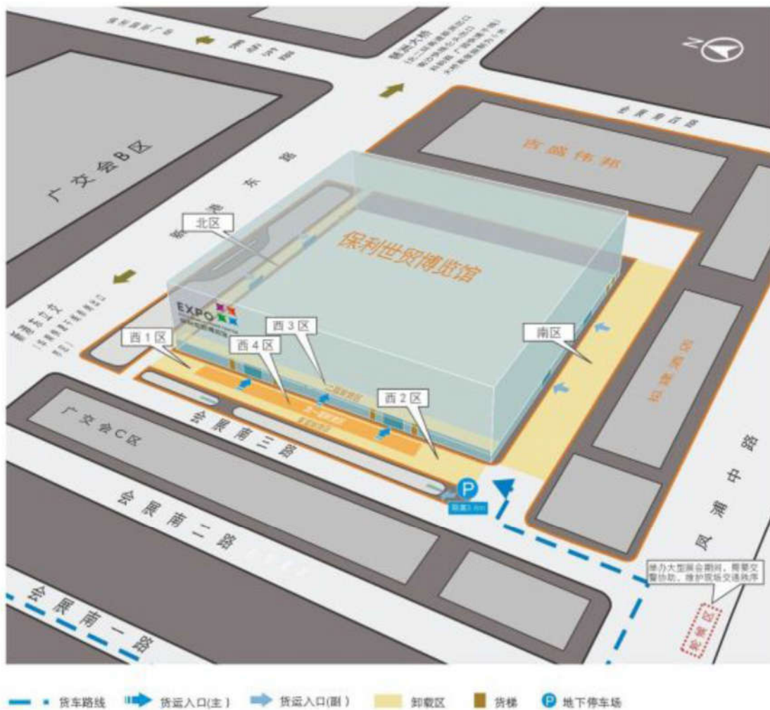
货车交通指南、卸货区域示意图