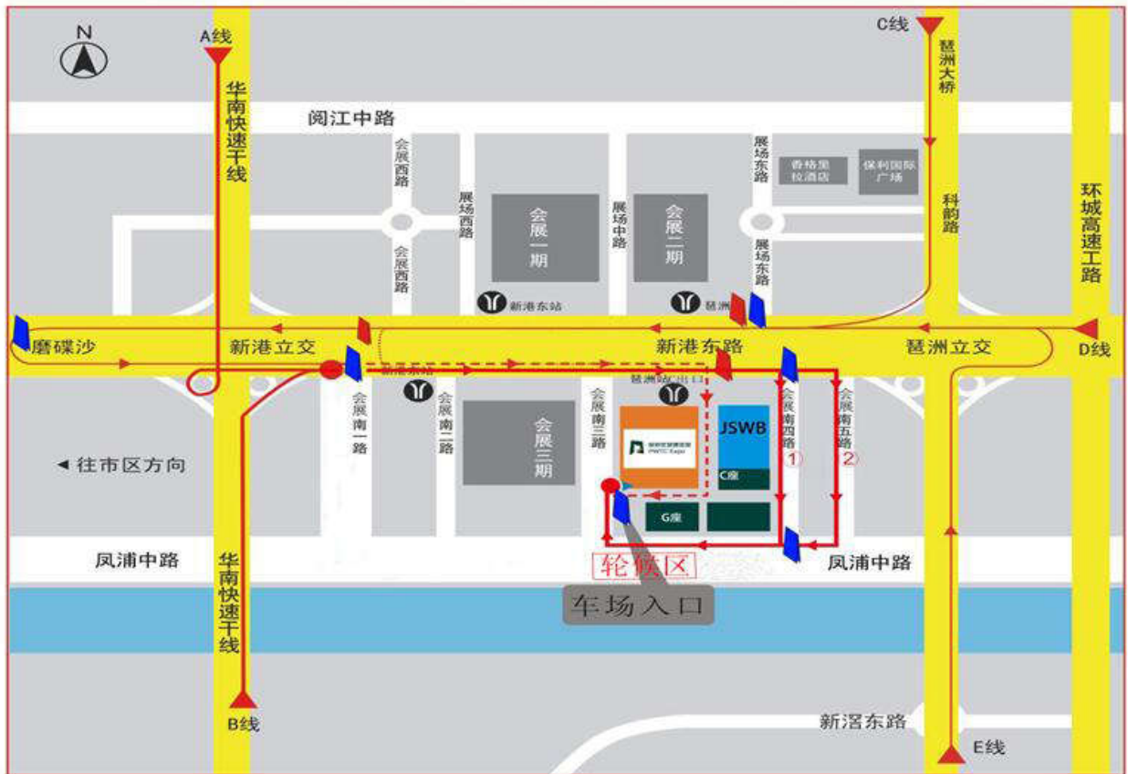
① ② 货车行驶路线